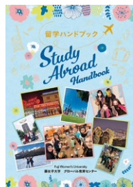
「留学ハンドブック」表紙