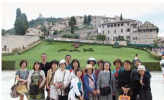
聖フランシスコ大聖堂の庭の前で

最後にケルン大聖堂に圧倒され、長いようであつという間の旅を終えました。多くの経験と人との出会いの機会を与えていただけたことに心より感謝します。