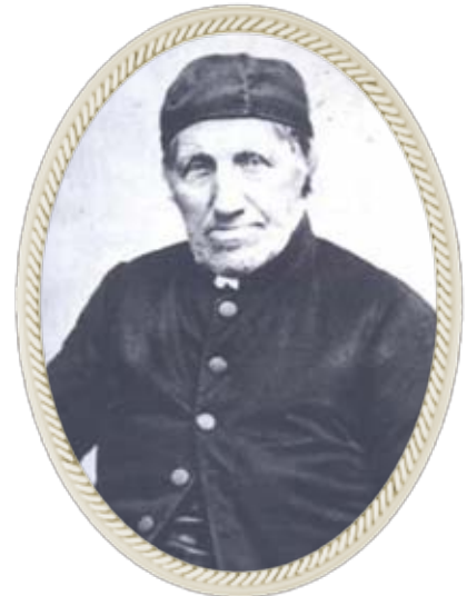
ゲルハルト・ダル神父 (1788～1874)