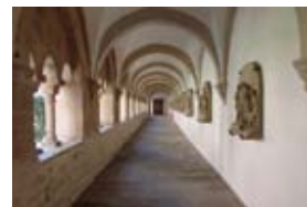
オスナブリュック大聖堂の回廊