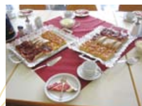
St.Raphael病院でのおもてなし