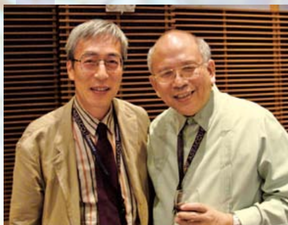
アテネオ・デ・ダバオ大学長(右)と共に

人間関係で大切だけれどむつかしいのは向かい合うことです。この8月下旬に4日間にわたって開催されたアジアカトリック大学連盟 (ASEACCU) 国際会議で経験した face-to-face すなわち向かい合うことについて語りたいと思います。この国際会議は英語を共通言語として、主催大学が決めるテーマのもとに毎年異なる国で開催されています。今年の第22回目の会議は、「社会正義のためのカトリック高等教育」をテーマに、フィリピンのミンダナオ島ダバオ市にあるアテネオ・デ・ダバオ大学で開催されました。8か国からの教職員91名と学生約80名が、それぞれ教職員プログラムと学生プログラムに参加しました。本学から参加した2名の学生による報告が本号に掲載されています。