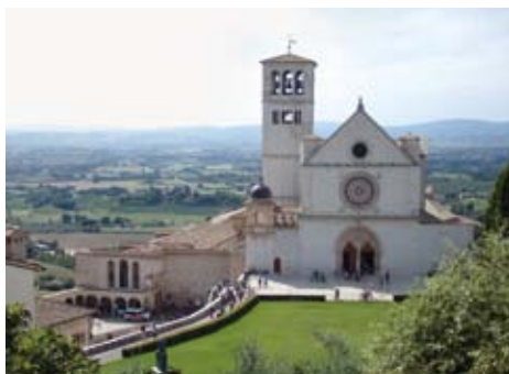
聖フランシスコ大聖堂上堂